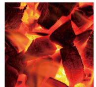
重たい炭も手配無料