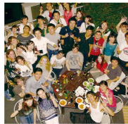
もちろん完全貸切