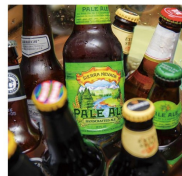
飲み物手配手数料無料 & 飲んだ分だけお得な精算